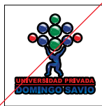
Uso de borde